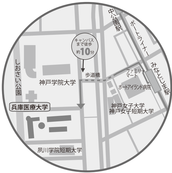
兵庫医療大学アクセス